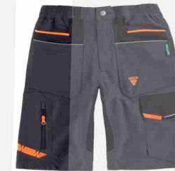
GRIS OSC. / NEGRO / NAR. FLÚOR