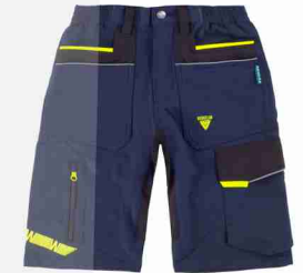
MARINO / NEGRO / AMA. FLÚOR