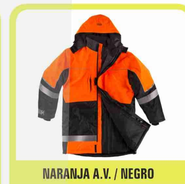
NARANJA A.V. / NEGRO