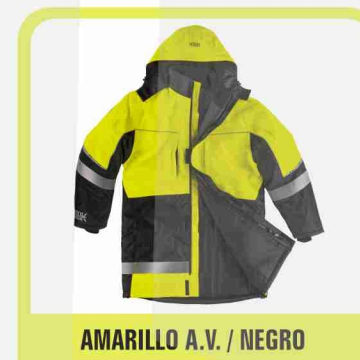
AMARILLO A.V. / NEGRO